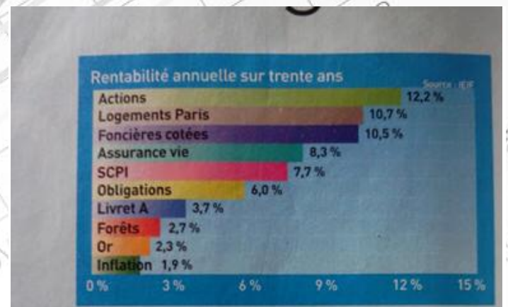
Les actions, en tête des placements qui font mieux que l'inflation.

C'est donc de la manipulation et cet article est le fruit de tout un système où se mêle incompétence, annonceurs et budgets pub, paresse, et corruption entre amis. La preuve en images. Lisez donc !