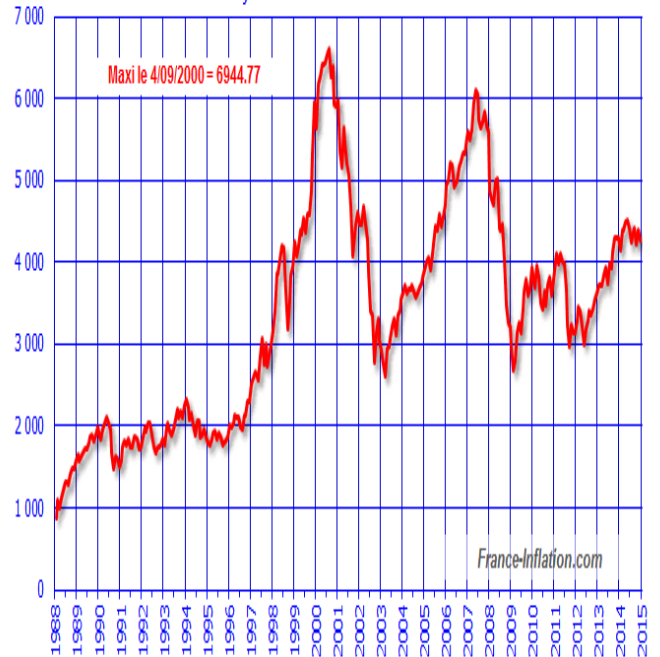
CAC40 depuis sa création au 31/12/87 en moyenne mensuelle